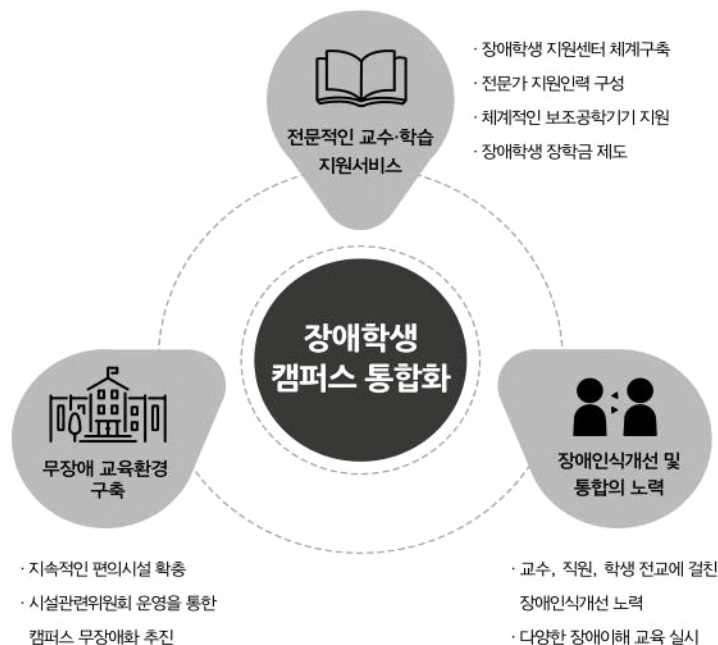
<그림2> 장애학생 교육복지 지원의 구조도

둘째, 지속적인 시설·설비의 보완과 무장애 교육환경 구축을 위한 노력을 기울이고 있다는 점이다. 본교의 오랜 역사와 지형적 제한성으로 인한 기존 건물의 접근상의 어려움을 장단기적인 계획에 의해 체계적으로 개선해왔으며, 교내시설 이용 시 장애학생 우선 배정 원칙이나 이동지원인력의 제공, 「장애인 편의시설 개선 실무위원회」 등을 통해 장애학생의 교육환경 이용 보장을 위해 최대한 지원하고 있다.